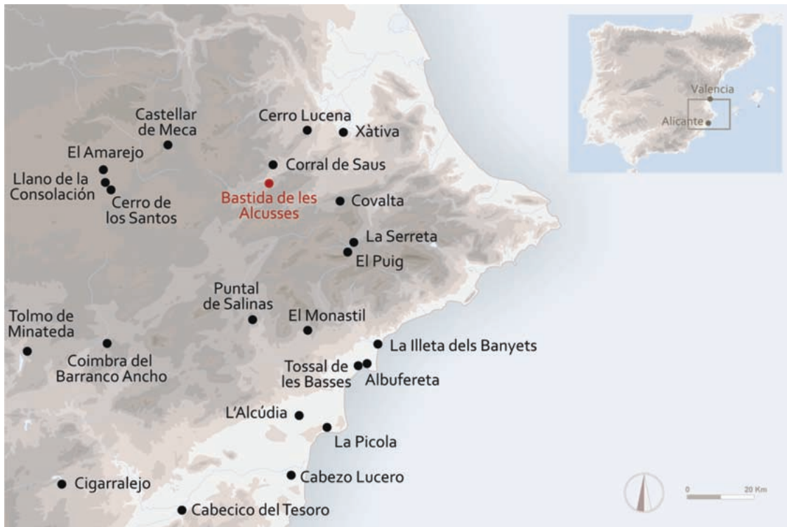
1. Situación de la Bastida de les Alcusses y de los principales yacimientos de la zona.